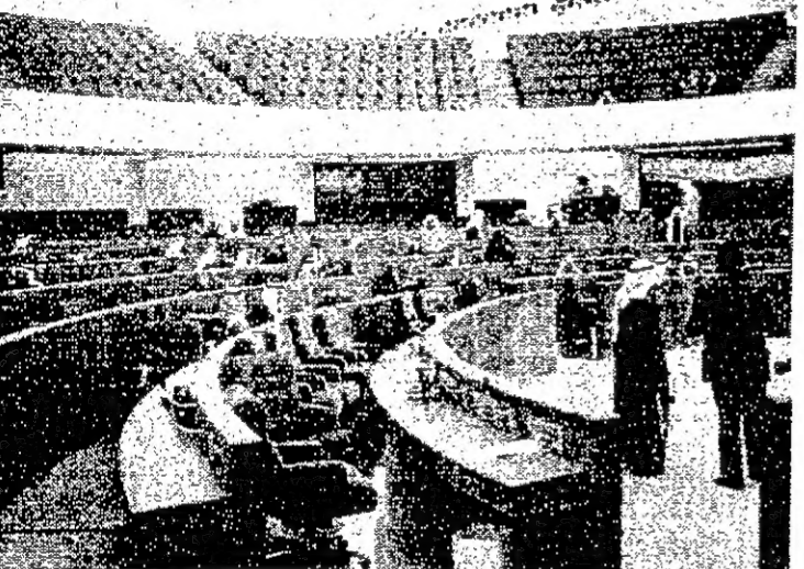
النواب ينتظرون عضواً واحداً